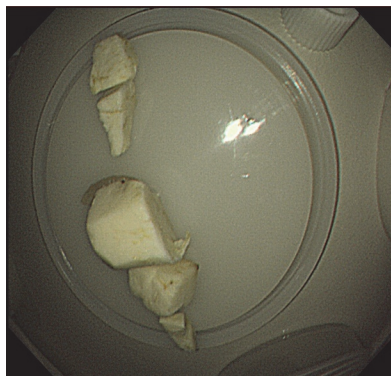
図2 Removed aconite roots